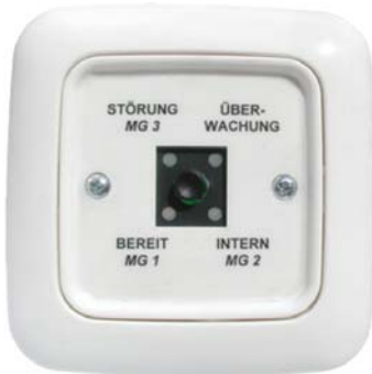
Ausführung Reflex Si alpinweiß

Melde Modul zum IES System unter anderem mit folgenden Eigenschaften.